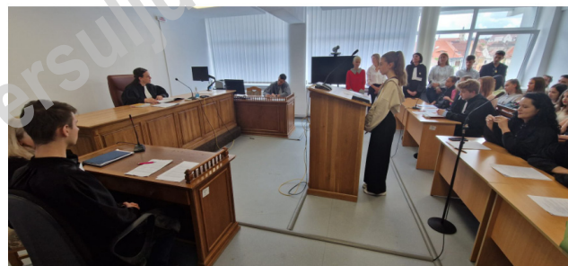
Câteva zeci de elevi de la Colegiul Național "Samuel von Brukenthal" din Sibiu și Liceul "Ilie Măcelariu" din Miercurea Sibului, au organizat și asistat vineri după-masă la simularea unui proces privind emiterea unui ordin de protecție.